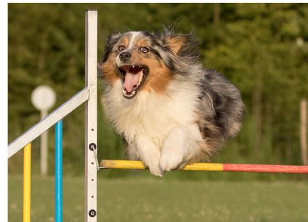
Canuck, Large mit Kira Fankhauser